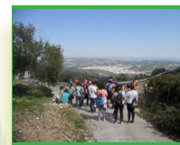
Nueva Carteya al fondo

PUNTOS DE AGUA: Sí. Fuente de las Espejas.