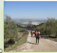
Nueva Carteya desde la ruta