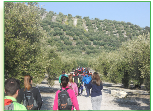
Camino arroyo Carchena